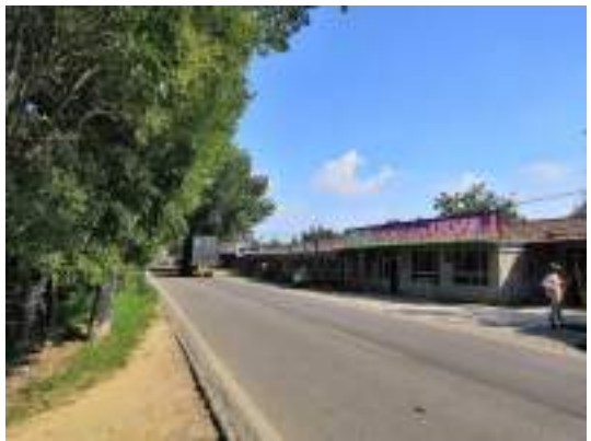
项目区南侧通房路