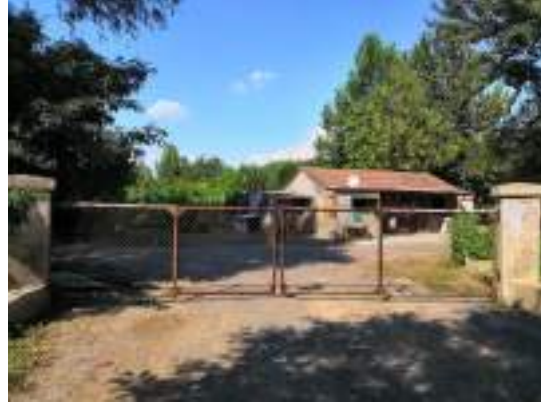
项目区北侧种植园